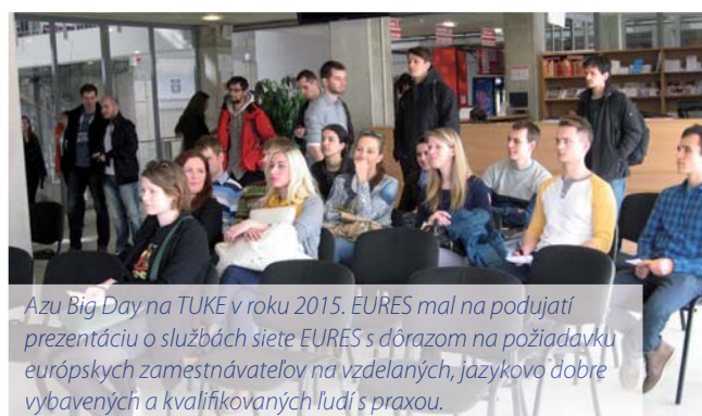
Azu Big Day na TUKE v roku 2015. EURES mal na podujatí prezentáciu o službách siete EURES s dôrazom na požiadavku európskych zamestnávateľov na vzdelaných, jazykovo dobre vybavených a kvalifikovaných ľudí s praxou.