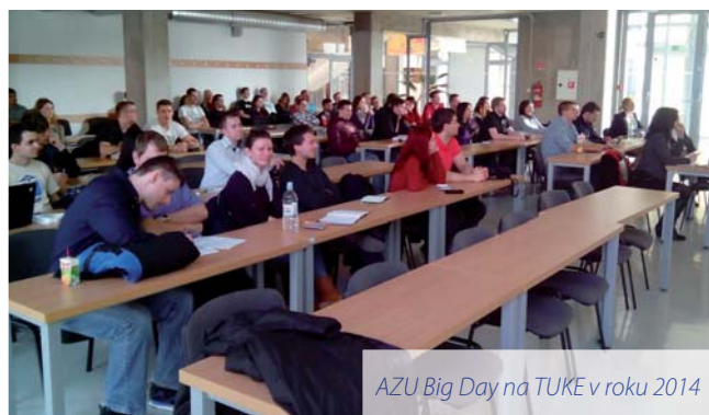
AZU Big Day na TUKE v roku 2014

EURES ponúka mladým ľuďom informácie aj prostredníctvom letáku, v ktorom nájdu základné informácie a odkazy na užitočné webové stránky.